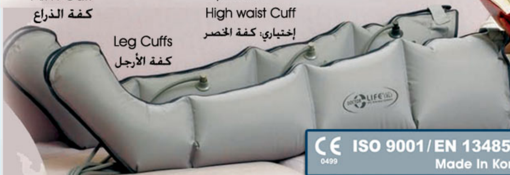
Leg Cuffs كفة الأرجل