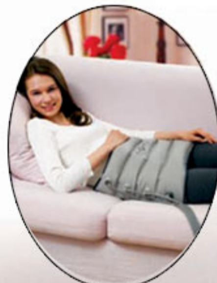
Optional: High waist Cuff إختياري: كفة الخصر