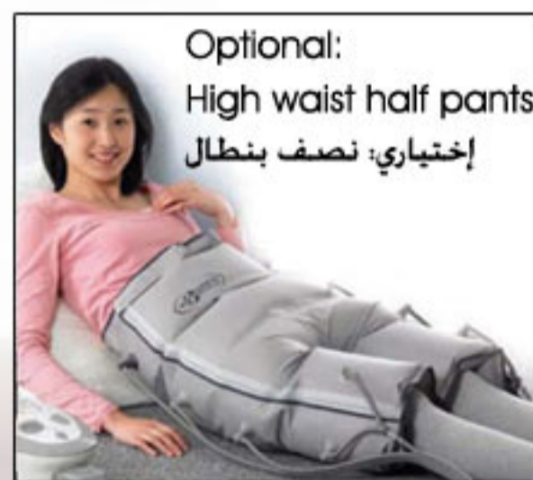
Optional: High waist half pants إختياري: نصف بنطال